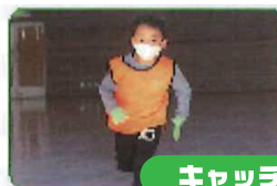
キャッチ&ランゲーム

ボールの投げ方や 打ち方のレッスン、 チームに分かれての 試合形式などを行います。