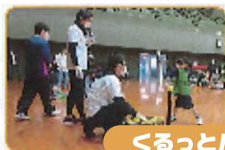
くるとバッティング